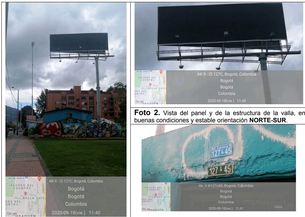
Foto 2. Vista del panel y de la estructura de la valla, en buenas condiciones y estable orientación NORTE-SUR .